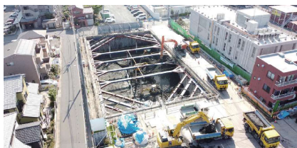
調整池の整備が進められています

執行部 8月の汚泥処分工事完了時点で実際の処分量が確定するため、来年1月までの変更事務期間中に、最終的な処分費用の確定と、変更契約を締結することになる。