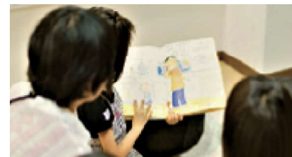
子供が安心して過ごせる居場所が求められます

執行部 現在、2人の内科医が不足している。人事課とも連携しながら常勤の医師の確保に努めたい。